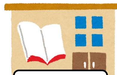
藤井寺市立図書館